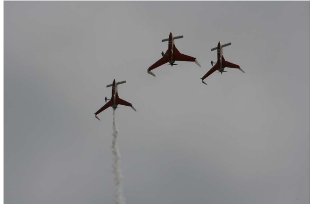
LE BALLET DES TANGO BLEUS