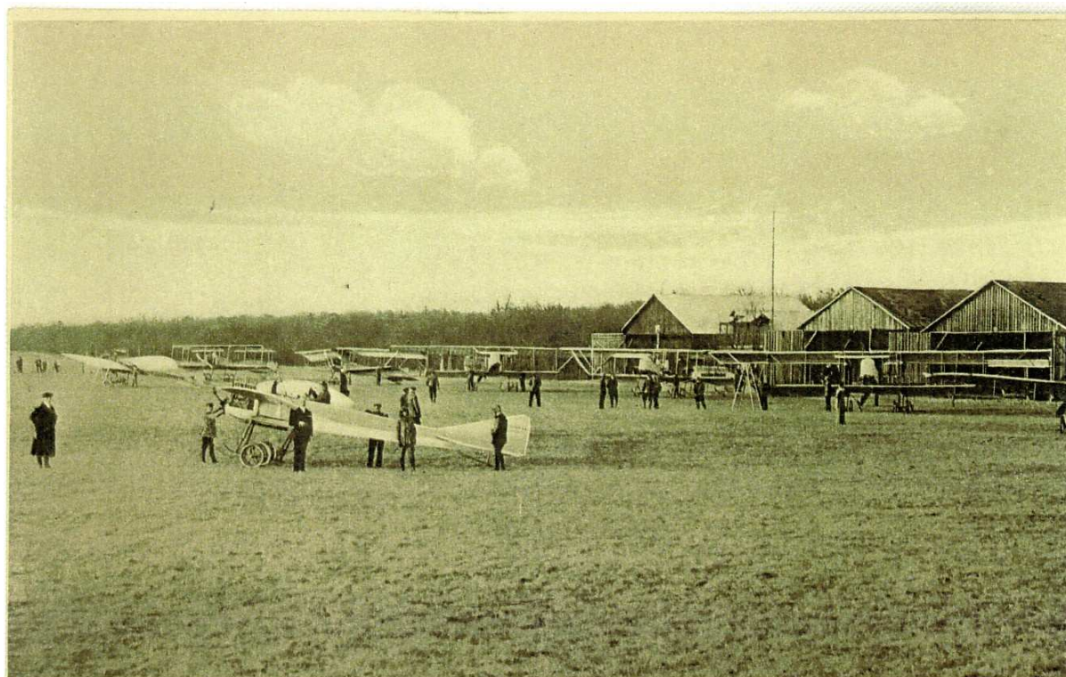
Automobil- & Aviatik, A.-G.