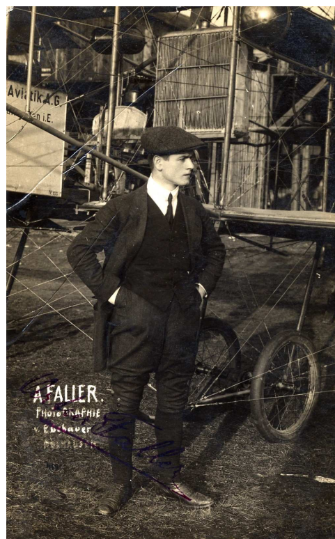
A. FALIER Photographie v. Gebauer Schul-Str.

Dans la semaine qui précède la fête, chacun connaît le poste qu'il aura à tenir. Les chambres froides regorgent de boissons et de victuailles, les programmes sont imprimés et reliés, les plans une nouvelle fois relus, les confirmations reconfirmées.